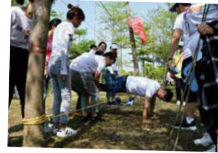
通关就靠最强大脑!

“穿越电网”,挑战不可能!每组10名参赛人员需要从电网的一面穿越到另一面,每次一人,且每个网孔仅可用一次,小组内任一组员一旦触网,全体组员必须重来!