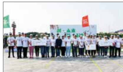
恭喜!现金支票奉上~

最后,由获奖事业部领队分别获奖发言,分享感悟、总结收获;活动总指挥陈锦程总监宣布,本次拓展圆满落幕!