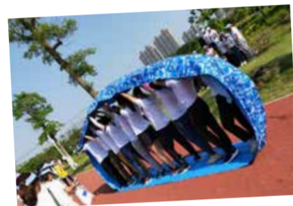
团队就是,步调一致向前进!默契度100%!

哪吒助力,“无敌风火轮”!参赛选手进入指定赛道,男女相间站立在“风火轮”内侧,肢体不可伸出圈外,集体前行200米完成挑战。